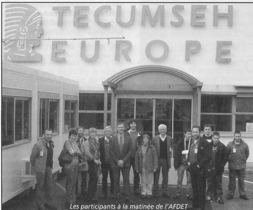
Les participants à la matinée de l'AFDET

Sur la base de 5 à 7 journées par an, ces rendez-vous accueillent plus de 200 participants la plupart du temps au sein même d'une entreprise. Ces matinées d'information donnent ainsi les pistes pour les formations initiales, alternées et continues pouvant mener aux métiers concernés. Ils étaient une quarantaine à participer à la matinée consacrée aux métiers de la maintenance industrielle organisée au sein de l'entreprise Tecumseh, parmi lesquels des enseignants du second degré, des conseillers d'orientation, des responsables d'organismes d'insertion, toutes celles et ceux qui ont un rôle d'information auprès